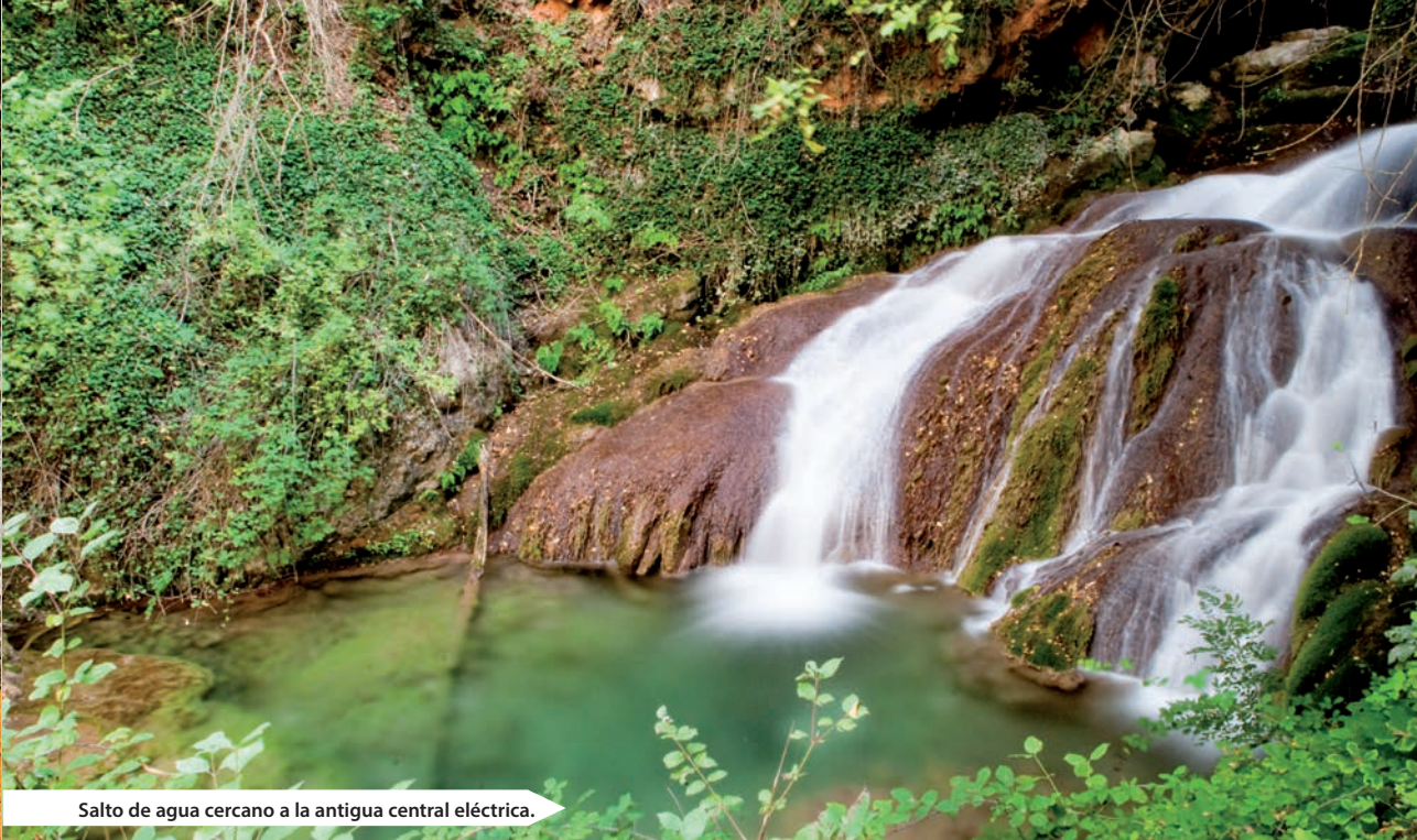
Salto de agua cercano a la antigua central eléctrica.

En este tramo, el río va encajonado por altas paredes y el camino se hace más agreste, ya que tiene que salvar los distintos saltos de agua. A alguno de estos podemos bajar por las sendas marcadas que aparecen a la izquierda del sendero.