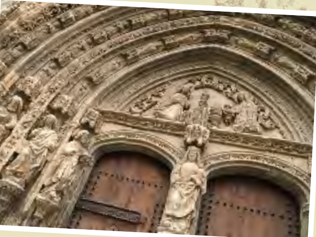
Requena 39° 29' 7.20" N 1° 6' 1.80" W