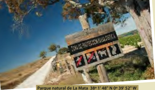
Parque natural de La Mata 38° 1' 48" N 0° 39' 52" W

La Mata - Torrevieja. De su interior, y con la ayuda de la sal del Pinoso, que llega desde su afamada montaña salobre mediante una conducción, se extrae la mayor producción de sal de toda España. Según los historiadores, los fenicios y los romanos ya extraían sal de este incomparable paraje.