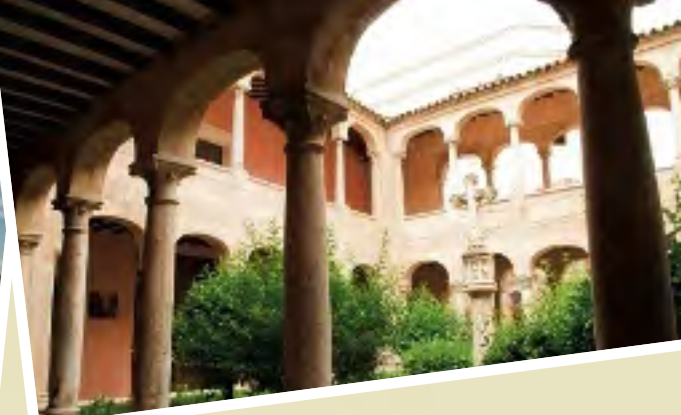
Orihuela 38° 5' 15" N 0° 56' 73" W

Llegados a Elx descubriremos que esta ciudad es la tercera en población de la Comunitat Valenciana, así como capital de la comarca del Baix Vinalopó. Los iconos de Elx son varios y diversos: su industria del calzado, la conocida Dama d'Elx, el Misteri d'Elx, Obra Maestra del Patrimonio Oral e Inmaterial de la Humanidad y, sobre todo, sus más de 200.000 palmeras, que abrazan la ciudad y le han dado parte de su fama, destacando entre ellas el emblemático palmeral del Hort del Cura. Todo el conjunto de palmeras constituye el bosque más meridional y