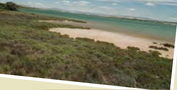
Laguna Salada de La Mata 38° 1' 21" N 0° 40' 15" W

vegetación de chumberas, un cactus que se alza hasta más allá de los dos metros y especies botánicas de flora que decoran obras arquitectónicas que han quedado como muestra de un tiempo histórico intenso: el faro de 1877, la torre de Sant Josep, del siglo XVIII, y el más solitario y tranquilo de todos los cementerios litorales valencianos. Pero es en el fondo marino donde más sorprende Tabarca: praderas de posidonia, caballitos de mar, tortugas de mar y cigalas, además de acantilados y calas.