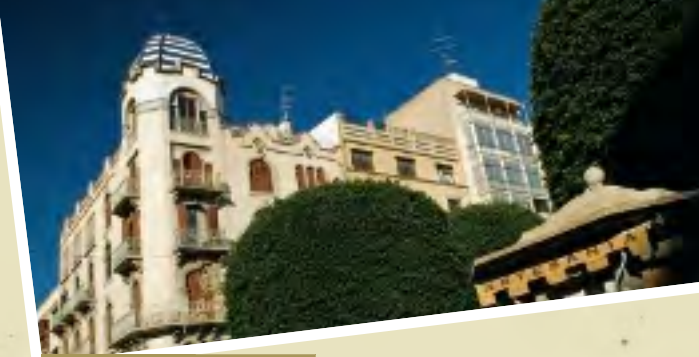
Elx 38° 16' 03" N 0° 41' 77" W

visual y estética a la industria salinera, y la Torre Tamarit, declarada Bien de Interés cultural, localizada en el mismo centro del parque y rodeada por un espejo de agua, es, sin duda, el emblema del parque. El espacio protegido, declarado parque natural en 1994, se extiende sobre un total de 2.496 hectáreas y en la actualidad todavía está permitida la caza entre octubre y enero y la pesca de la anguila con métodos tradicionales.