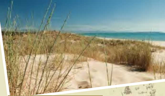
Dunas de Guardamar 38° 6' 78" N 0° 38' 52" W

centro de información del parque natural. Allí se puede disfrutar de todo tipo de instalaciones didácticas entre las que destacan la visión de una cámara que transmite, en tiempo real, las imágenes del interior de la zona más sensible del parque, allí donde nidifican y hacen vida cotidiana las especies de la avifauna más característica del parque.